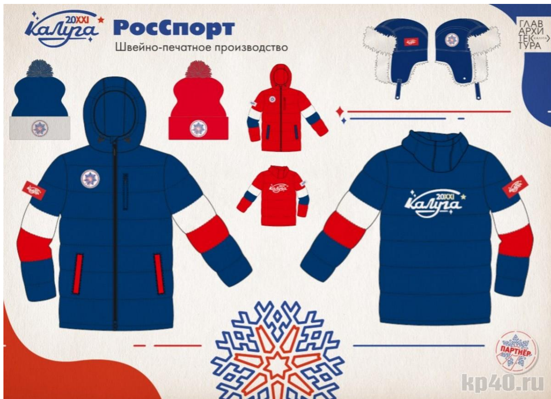
Рис. 19. Новогоднее швейно-печатное производство