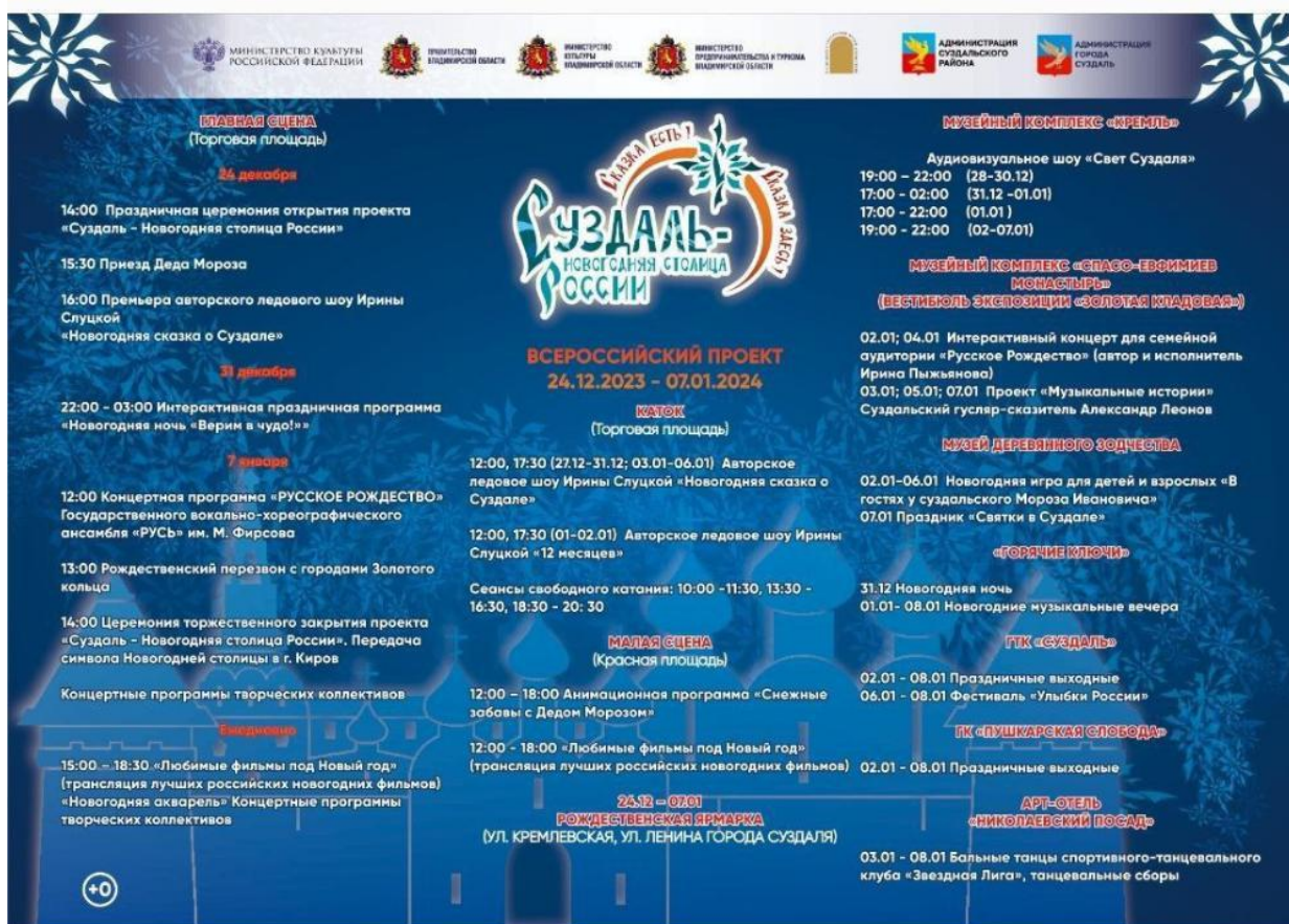
Рис. 26. Новогодняя афиша

Информационная афиша демонстрирует проблемы, характерные для многих региональных проектов. Использование множества шрифтов и начертаний (от декоративных заголовков до мелкого информационного текста) создает визуальную какофонию. Белый и красный текст на синем градиентном фоне с наложенными снежинками существенно снижает читаемость, особенно в блоках с расписанием мероприятий (См. Рис. 26).