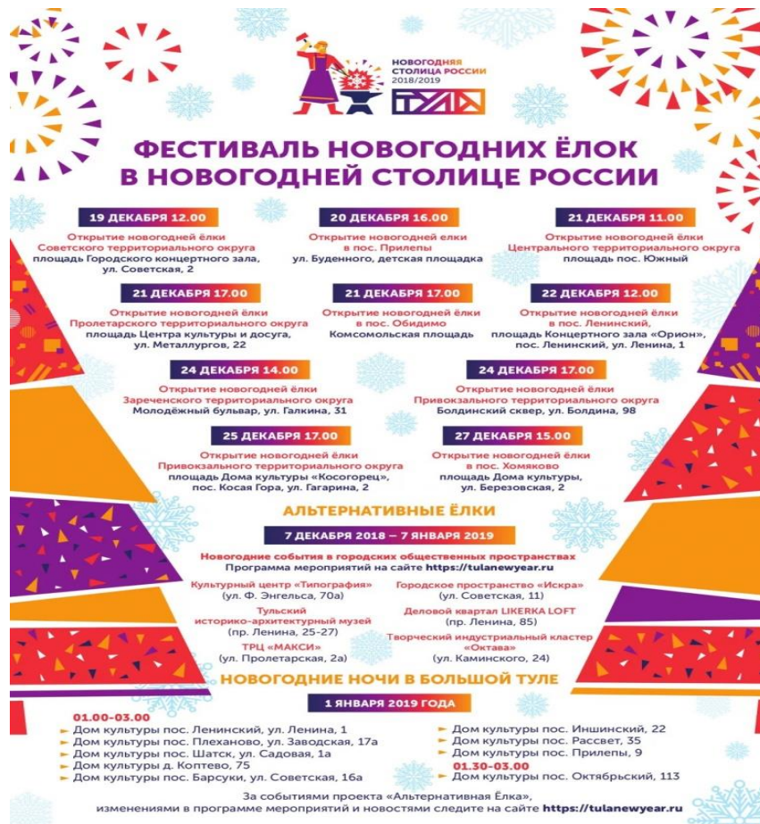
Рис. 11. Фирменная афиша Тулы