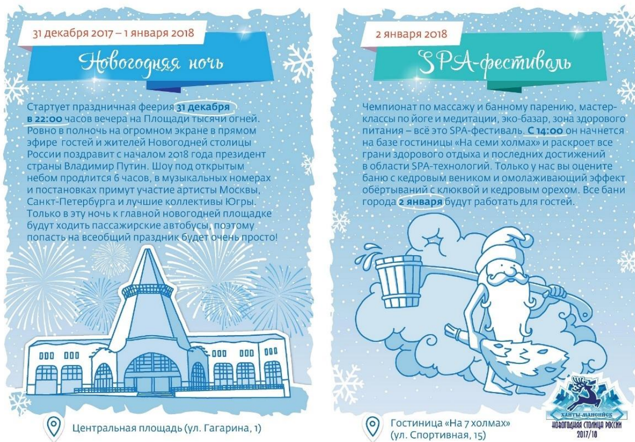
Рис. 9. Новогодняя афиша Ханты-Мансийска

Вместе с тем при ближайшем рассмотрении обнаруживаются существенные недостатки. Прежде всего, бросается в глаза перегруженность композиции текстовой информацией. Мелкий шрифт основного текста плохо читается на пёстром фоне со снежинками. Градиентные плашки под заголовками выглядят устаревшими – такие решения были популярны в веб-дизайне начала 2000-х годов. Кроме того, отсутствует чёткая визуальная иерархия: взгляд блуждает по афише, не зная, на чём остановиться в первую очередь. Особенно неудачным представляется изображение Деда Мороза на правой части афиши. Персонаж выглядит статично, его поза неестественна, а упрощённая стилистика граничит с примитивизмом. Для главного новогоднего волшебника страны можно было создать более харизматичный и запоминающийся образ.