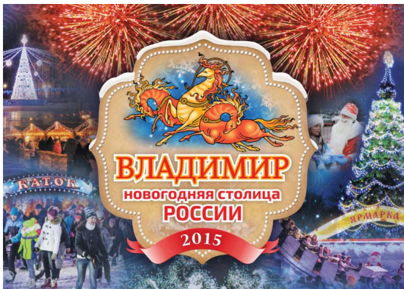
Рис. 3. Новогодний логотип Владимира

национального праздника. Владимир, входящий в Золотое кольцо России и обладающий статусом города-музея под открытым небом, получил уникальную возможность актуализировать свое историческое наследие через призму современной событийной культуры.