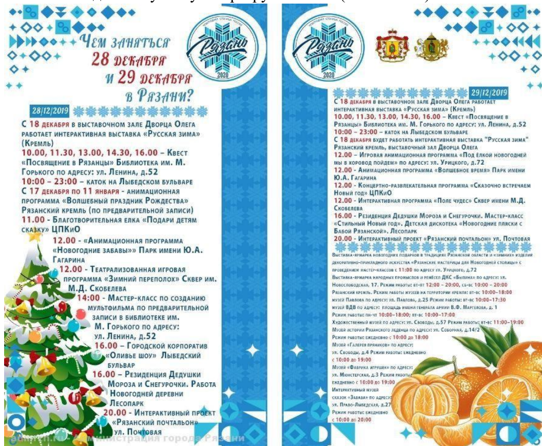
Рис. 16. Новогодняя афиша

Афиши мероприятий демонстрируют попытку систематизации большого объема информации. Композиционное решение основано на двухколоночной вёрстке с выделением временных блоков и адресов проведения мероприятий. Используются цветовые акценты для навигации по контенту: красный цвет для выделения времени, синий – для основного текста. Декоративное оформление включает геометрические элементы (ромбы, треугольники) и иллюстративные элементы. Данные элементы призваны создать праздничную атмосферу, однако их обилие создаёт визуальную перегруженность (См. Рис. 16).