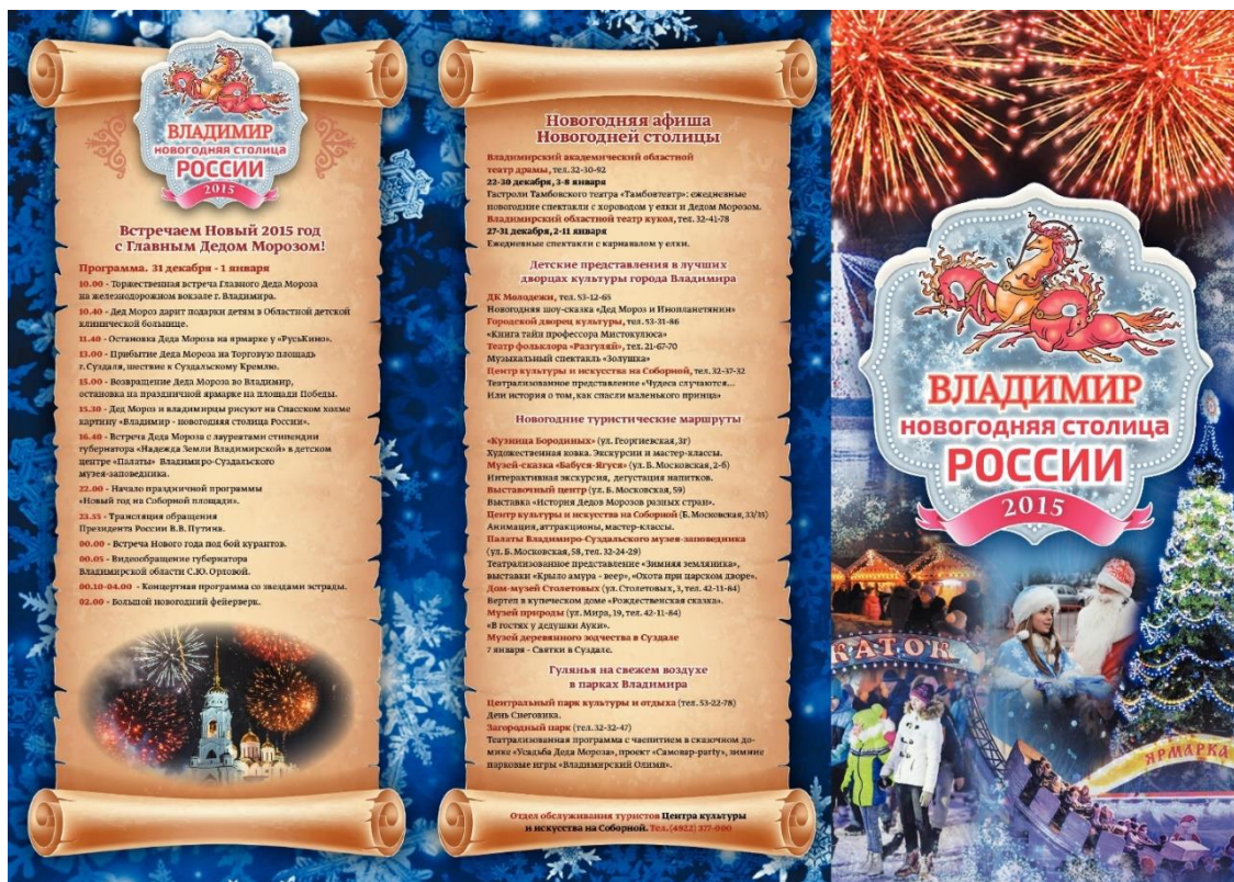
Рис. 4. Новогодняя афиша Владимира