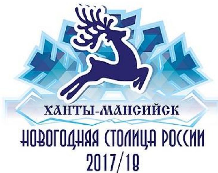
Рис. 8. Новогодний логотип Ханты-Мансийска

Центральным элементом композиции логотипа выступает стилизованное изображение северного оленя. Олень изображён в динамичном прыжке, что создаёт ощущение движения и праздничной энергии. Фоном служит снежинка, выполненная в геометрической манере с использованием градиентов от светло-голубого к насыщенному синему (См. Рис. 8). Типографическое решение вызывает смешанные чувства. Название города выполнено классическим шрифтом с засечками, что придаёт солидность, но лишает композицию современности. Подпись «Новогодняя столица России 2017/18» набрана более простым шрифтом, создавая некоторый визуальный диссонанс. Кроме того, использование косой черты в обозначении временного периода выглядит несколько небрежно. Для официального логотипа федерального проекта можно было найти более элегантное решение. Что касается афиши мероприятий (См. Рис. 9), то в ней наблюдается попытка создать более тёплую и дружелюбную атмосферу. Изображения Деда Мороза в облаках и стилизованного здания вокзала создают сказочную атмосферу.