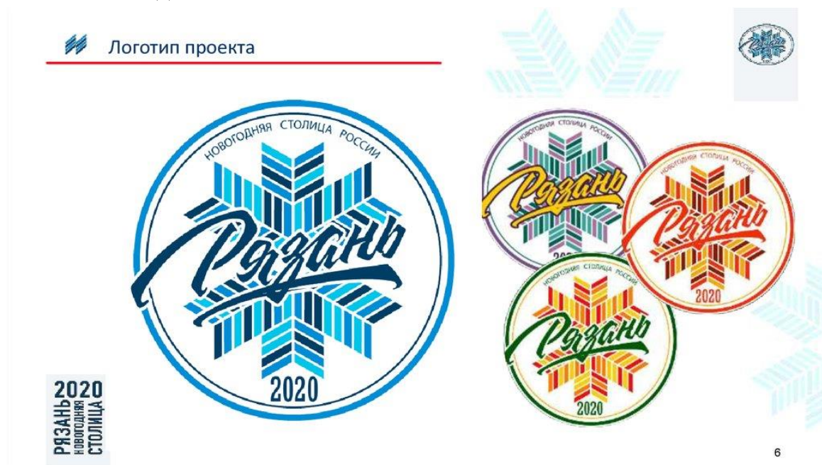
Рис. 14. Новогодний логотип Рязани в 2020 году

Основой визуальной айдентики стал логотип в форме снежинки с названием города (См. Рис. 14). Геометрическая структура снежинки построена на шестилучевой симметрии с использованием угловых элементов, создающих ощущение кристаллической структуры. Типографическое решение названия «Рязань» выполнено в рукописной манере, что создаёт контраст с геометричностью основной формы. Цветовая схема базируется на холодной гамме с доминированием оттенков синего. В дополнительных версиях логотипа использованы альтернативные цветовые решения: бирюзово-сиреневый, красно-оранжевый и красно-бордовый варианты. Данная вариативность предполагала использование разных версий для различных коммуникационных контекстов в разные времена года (весна, лето, осень), однако система их применения осталась неочевидной.