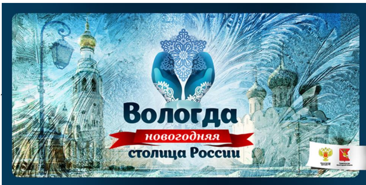
Рис. 2. Новогодний логотип Вологды

Концептуальная основа логотипа построена на интеграции узнаваемого локального мотива – вологодского кружева – в новогоднюю символику. Это принципиально важный шаг вперед по сравнению с дизайн-решением Казани. Стилизованная снежинка, составленная из кружевных паттернов, создает мгновенную ассоциацию с главным культурным брендом региона. Такой подход демонстрирует понимание сути территориального брендинга – необходимости транслировать уникальность места через визуальные коды.