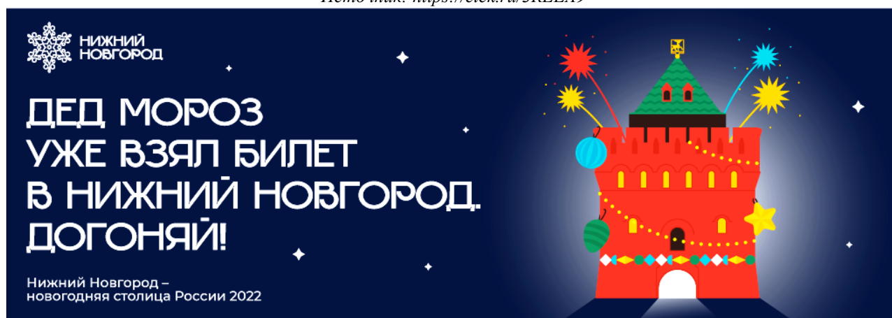
Рис. 21. Рекламный плакат