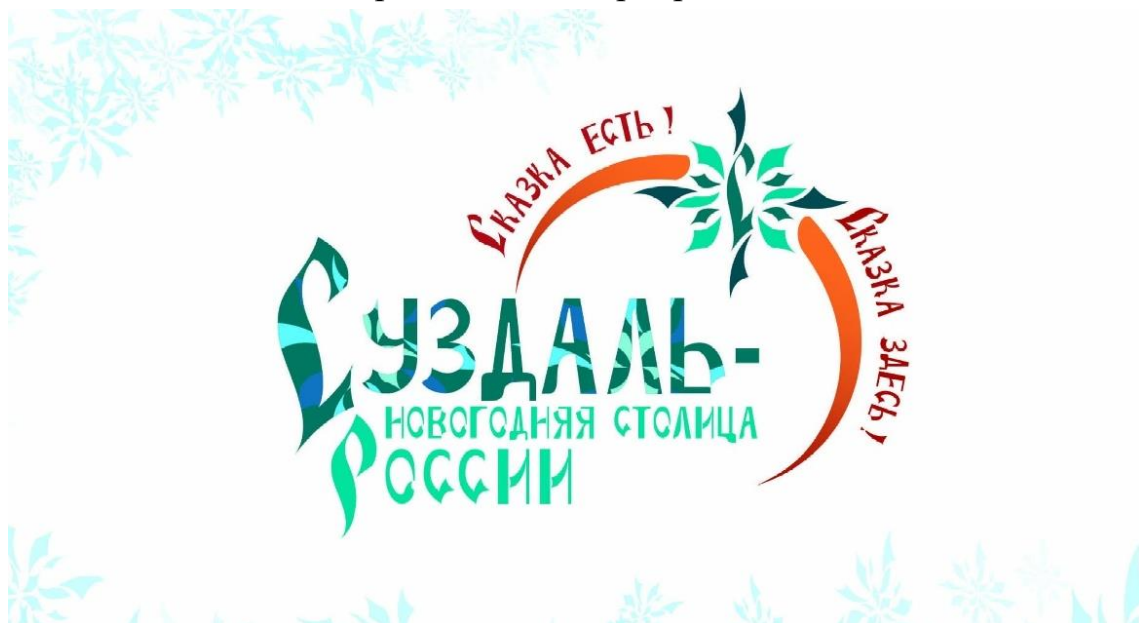
Рис. 25. Новогодний логотип Суздаля

Суздаль стал первым малым городом в истории проекта «Новогодняя столица России», получив этот статус на период 2023-2024 годов. Выбор Суздаля можно рассматривать как стратегическое решение, направленное на популяризацию малых исторических городов России и развитие культурно-познавательного туризма в регионах с богатым историческим наследием. Суздаль, входящий в Золотое кольцо России и включенный в список Всемирного наследия ЮНЕСКО, обладает уникальной сохранностью исторической среды. Город располагает более чем 200 памятниками архитектуры, включая Суздальский кремль, Покровский и Спасо-Евфимиев монастыри. Такая историческая аутентичность создавала как преимущества, так и ограничения для организации масштабных праздничных мероприятий.