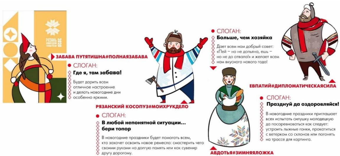
Рис. 15. Новогодние персонажи

Афиши мероприятий демонстрируют попытку систематизации большого объема информации. Композиционное решение основано на двухколоночной вёрстке с выделением временных блоков и адресов проведения мероприятий. Используются цветовые акценты для навигации по контенту: красный цвет для выделения времени, синий – для основного текста. Декоративное оформление включает геометрические элементы (ромбы, треугольники) и иллюстративные элементы. Данные элементы призваны создать праздничную атмосферу, однако их обилие создаёт визуальную перегруженность (См. Рис. 16).