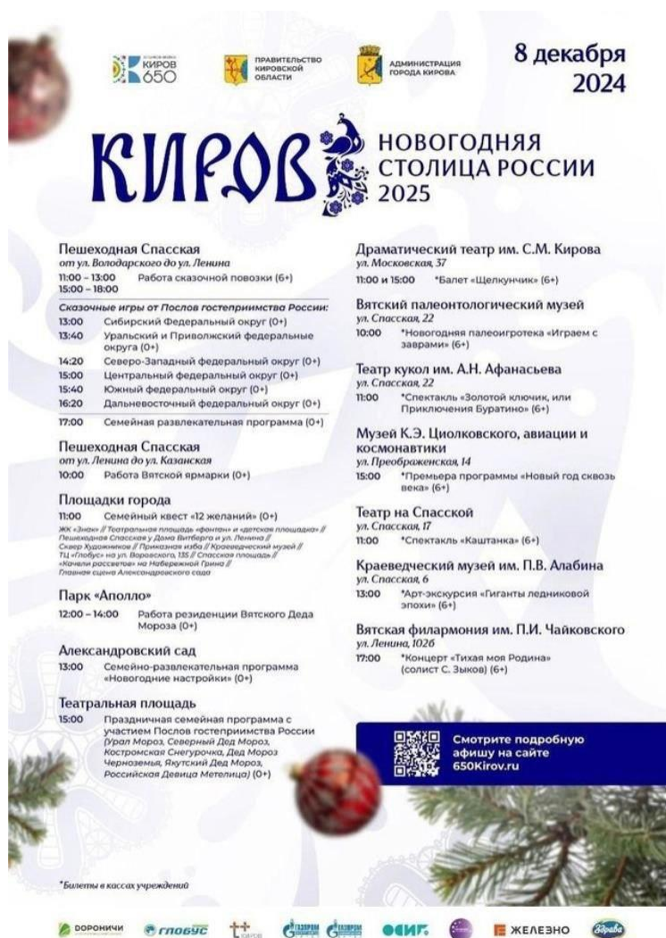
Рис. 28. Новогодняя афиша

Монохромное исполнение в бело-синей гамме представляет собой классическое решение для зимней тематики. Насыщенный синий фон создает ассоциации с ночным небом и одновременно обеспечивает высокий контраст для белых элементов. Это решение функционально с точки зрения различимости и воспроизведения на различных носителях. Отсутствие дополнительных цветов можно рассматривать как стремление к визуальной чистоте и избежание излишней пестроты, которой отличаются некоторые носители стиля.