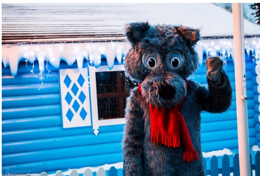
Рис. 7. Новогодний маскот Тамбова