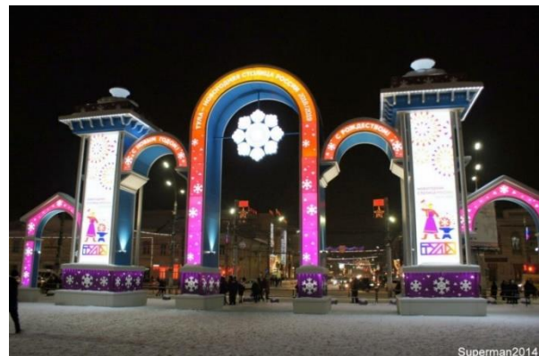
Рис. 13. Дизайн городского пространства