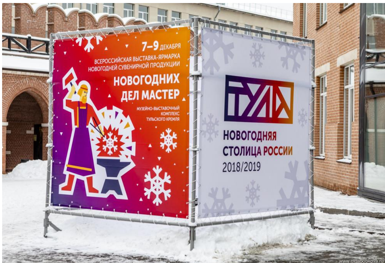
Рис. 10. Новогодний логотип Тулы

города представлялся весьма логичным: Тула обладает развитой инфраструктурой, находится в относительной близости от Москвы и имеет узнаваемый туристический бренд.