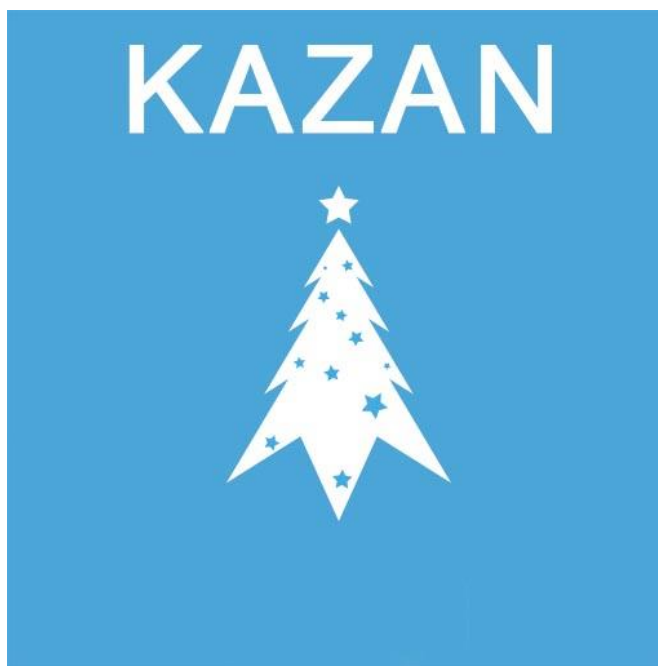
Рис. 1. Новогодний логотип Казани

Композиционное решение логотипа предельно лаконично. Геометризованная ёлка под текстовым блоком создаёт классическую вертикальную композицию. Такая простота обеспечивает хорошую читаемость и масштабируемость, что критически важно для событийного брендинга. Однако эта же простота граничит с банальностью – такой символ мог бы принадлежать любому зимнему событию в любом городе. Типографика использует чистый геометрический гротеск без засечек, что соответствует современным стандартам, но полностью игнорирует культурную специфику Казани. В городе с богатейшей традицией каллиграфии и уникальным визуальным наследием выбор нейтрального западного шрифта выглядит упущенной возможностью. Даже минимальная стилизация или включение элементов, отсылающих к татарской графической культуре, могли бы добавить идентичности. Символика ёлки решена через остроугольную стилизацию с хаотично разбросанными звездами разного размера. Это единственный элемент, вносящий некоторую динамику, но и здесь есть проблемы. Асимметричное расположение звёзд создает визуальный дисбаланс, а их количество и размеры кажутся случайными. Отсутствует ритм, иерархия, система. Более того, сама форма елки излишне агрессивна, острые углы создают ощущение колкости, а не праздничности.