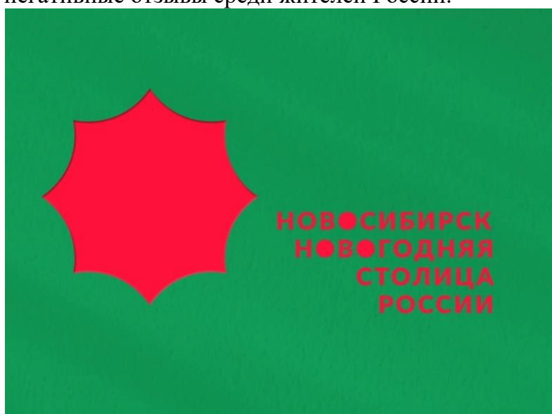
Рис. 23. Новогодний логотип Новосибирска

Визуальная идентичность проекта представляет собой компромисс между стремлением к оригинальности и необходимостью следовать устоявшимся праздничным кодам. Основной логотип можно признать удачным с точки зрения запоминаемости и технического исполнения, но ему не хватает локальной специфики и эмоциональной теплоты. Примечательно, что новосибирская дизайн-система получила самые негативные отзывы среди жителей России.