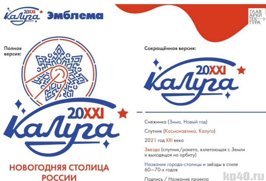
Рис. 17. Новогодний логотип Калуги

Калуга получила статус Новогодней столицы России на период 2020-2021 годов в условиях пандемии COVID-19, что существенно трансформировало подходы к организации массовых мероприятий. Город, известный как «колыбель космонавтики» благодаря деятельности К.Э. Циолковского, должен был продемонстрировать способность проводить федеральные праздничные мероприятия в условиях действующих санитарно-эпидемиологических ограничений. Первоначальная концепция предполагала масштабные уличные гуляния, концерты с участием федеральных звезд, массовые спортивные мероприятия. Однако реальность внесла существенные коррективы: акцент сместился на камерные мероприятия, онлайн-трансляции и световое оформление городского пространства.