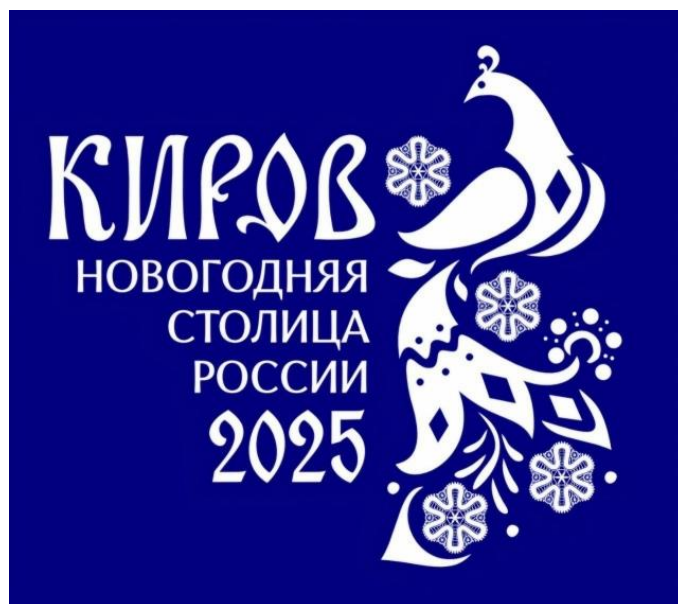
Рис. 27. Новогодний логотип Кирова

Центральным элементом визуальной идентичности проекта является сложносоставной логотип, объединяющий несколько символических элементов. Доминирующую позицию занимает стилизованное изображение жар-птицы, выполненное в декоративной манере с обилием орнаментальных деталей. Выбор птицы как центрального образа может быть интерпретирован через призму народных сказок и фольклорных традиций Вятского края.