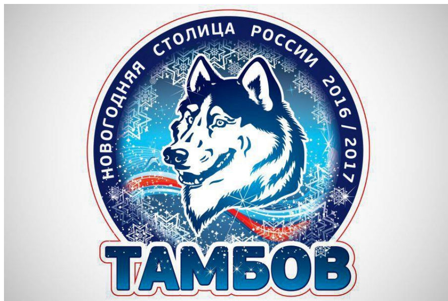
Рис. 6. Новогодний логотип Тамбова

изображениями снежинок, создающими новогоднюю атмосферу. Цветовая гамма выдержана в холодных сине-голубых тонах с акцентом красного цвета, что соответствует традиционной новогодней палитре. Однако при более детальном анализе обнаруживаются существенные недостатки данного решения. Прежде всего, использование образа волка представляется спорным выбором, учитывая неоднозначность его восприятия в массовом сознании. Попытка создать «милого» волка привела к определённой инфантилизации образа, что входит в противоречие с солидностью федерального проекта.