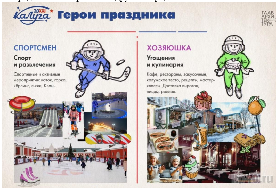
Рис. 18. Новогодние герои

центр. Логотип выглядит современно и прогрессивно, что выгодно отличает его от более традиционных решений других городов.