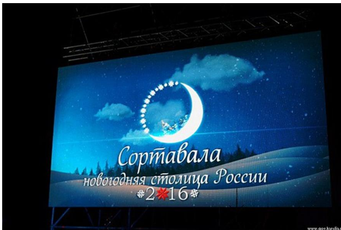
Рис. 5. Новогодний логотип Сортавалы

На рубеже 2015-2016 годов почётное звание перешло карельскому городу Сортавала. Выбор именно этого города в качестве новогодней столицы России был обусловлен стремлением федеральных властей привлечь внимание к развитию внутреннего туризма в Карелии. Опыт проведения мероприятий такого уровня позволил Сортавале укрепить свои позиции как туристического центра Северного Приладожья. Некоторые объекты праздничной инфраструктуры были сохранены и интегрированы в сферу гостеприимства.